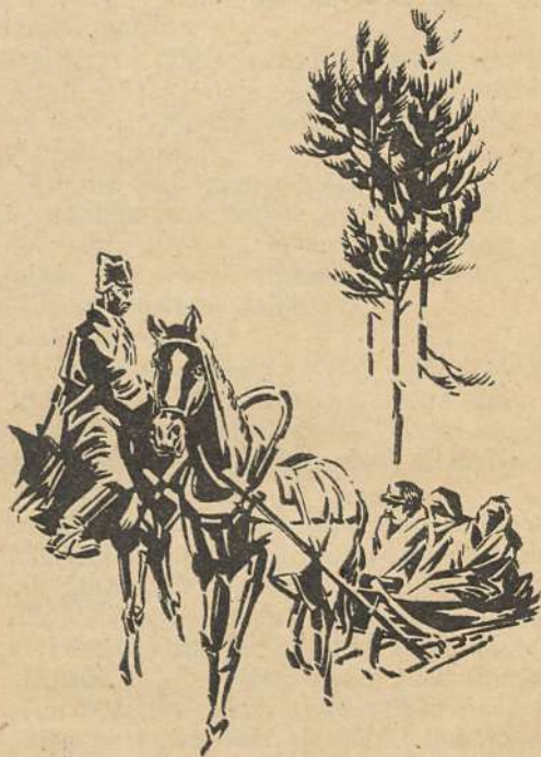
Kaarli võttis tundmatu tervituse vastu. (Vt. lhk. 55)